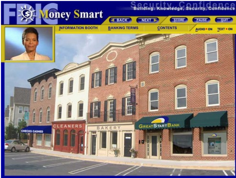
Penny Cash (tal como se ve en el extremo superior izquierdo) guía al consumidor a través del programa.