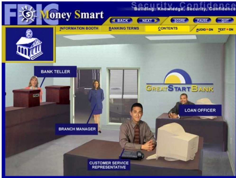
El CBI presenta al consumidor los empleados bancarios y explica los distintos servicios que ofrecen.