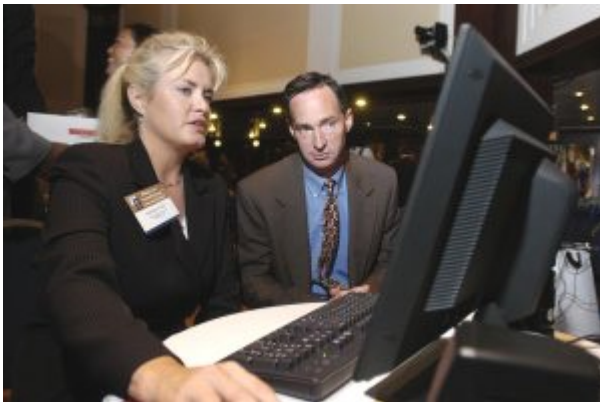
Después de la presentación, la audiencia pudo probar el programa Money Smart CBI instalado en varias computadoras.