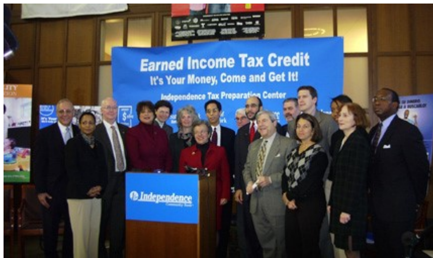
La apertura oficial del Centro de Preparación Impositiva del Independence Community Bank fue el 23 de febrero de 2004.

Región de New York: Como parte de los programas continuos de extensión en capacitación financiera, el personal de Programas para la Comunidad alienta a los bancos participantes a formar parte de las campañas de EITC y el desarrollo de sitios VITA. Los voluntarios en diez sitios del área metropolitana de New York (Fordham Road, South Bronx, Downtown Brooklyn, Bedford Stuyvesant, Sunset Park, Northern Manhattan, Midtown, Harlem, Jamaica y Jackson Heights) operados por el Community Food Resource Center ya han preparado 12,200 declaraciones de impuestos a los primeros días de marzo. Los reintegros alcanzaron un sorprendente total de $17,408,797. De este total, $9,107,597 correspondieron a EITC y $2,050,824 al Child Tax Credits (CTC), un crédito impositivo federal por un valor de hasta $1,000 por cada hijo dependiente menor de 17 años. El sitio de asistencia impositiva gratuita del Downtown Brooklyn estuvo auspiciado por el Independence Community Bank, un Socio de la Alianza de Money Smart . Los empleados del banco ofrecen permanentemente clases de Money Smart , y el banco se encuentra abocado a ofrecer acceso a los productos y servicios bancarios que puedan ayudar a clientes de bajos a moderados ingresos a comenzar construir su patrimonio y obtener libertad financiera.