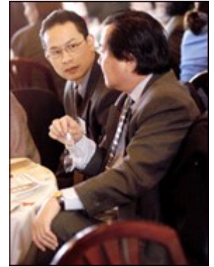
El 11 de febrero de 2004, la FDIC lanzó oficialmente Money Smart en una ceremonia realizada en un restaurante vietnamita en Falls Church, VA, en las afueras de Washington, DC. También se realizaron ceremonias en Westminster, el Little Saigon de CA y en Houston, TX.